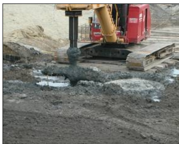
图 6-2 国外大型搅拌混合设备