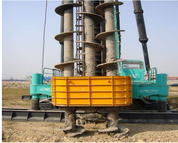
图 6-3 三轴搅拌设备