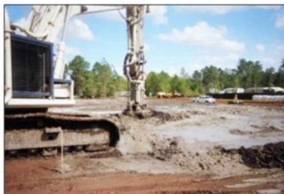
图 6-1 浅层搅拌设备

原位投加的药剂存在影响地下水 pH 值、电导率和硫酸根等指标变化的可能，造成地下水质量恶化，腐蚀地下结构，因此不能过度添加。