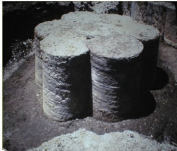
图 6-4 原位固化/稳定化后形成的固化体